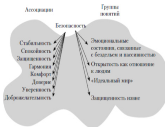
Рис. 2. «Феномен безпеки у буденній свідомості»